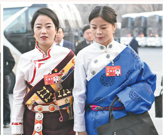
步入会场