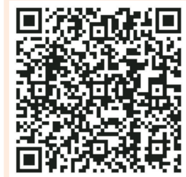
(扫一扫在手机打开当前页)