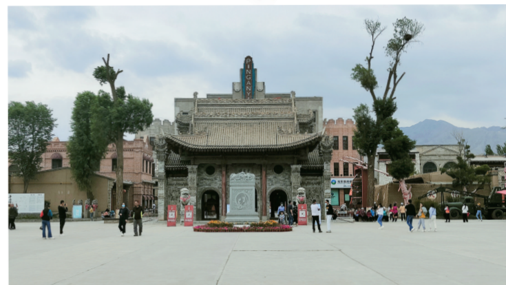
平安驿·河湟民俗体验地。

平安驿·河湟民俗文化体验地，游人通过参加手绘灯笼大赛、民俗社火展演、共度腊八节、元宵吃汤圆、敲响平安钟等精彩文化体验活动，从中品鉴河湟建筑、品尝河湟美食、品味河湟艺术；在撒拉尔故里民俗文化园，通过民俗博物馆、婚俗体验馆、撒拉尔印象民居等特色景点，“一网打尽”撒拉族民俗风情。