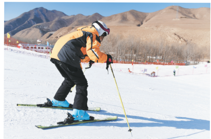
游客在乐都瞿昙国际滑雪场滑雪。

平安莲花山冰雪大世界以现服务设施和雪地摩托、雪地坦克、雪地悠游球、雪地碰碰球、雪地自行车等17种游玩项目，供游客体验冰雪运动之美；全省规模最大、设施最齐全、项目最多的瞿昙国际滑雪场，单板滑雪、双板滑雪、马拉雪橇、冰上碰碰车等9个滑雪项目，开启冬春季滑雪系列活动，进一步丰富旅游产品供给。