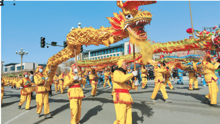
河湟传统社火集中展演。

以“青海年·醉海东”、冬春季冰雪嘉年华、迎新春文艺晚会、河湟传统社火集中展演等文化惠民活动，为游人呈现一场场丰盛的文化大餐；游人还可体验到各地举办的送戏、送书、送电影、送春联等文化活动，乐享社火表演、非遗展演、民俗体验、年货大集、冰雪游乐等丰富的旅游活动。