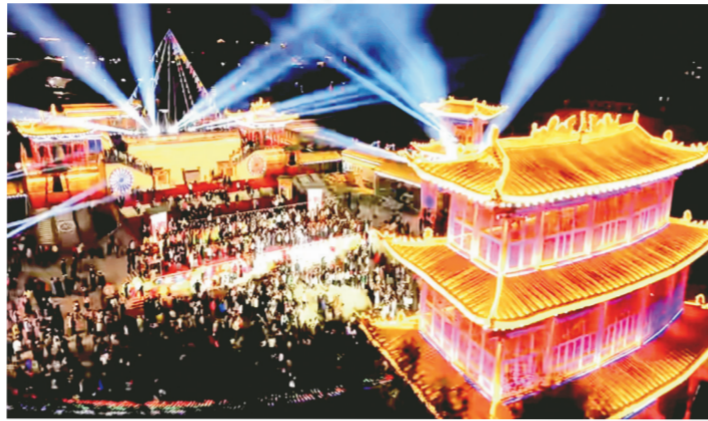
互助土族故土园内的灯光秀。

海东，更是通过丝路花儿艺术节、“青海年·醉海东”等品牌文化活动“放大效应”，用保护、传承、挖掘等具体行动，以全域、全时、全季等谋划布局，让民俗文化火起来、惠民活动多起来、全季旅游热起来，让游客离开海东时恋恋不舍、想起海东时念念不忘的同时，擦亮了“彩陶故里、拉面之乡、青绣之源、醉美海东”金名片。