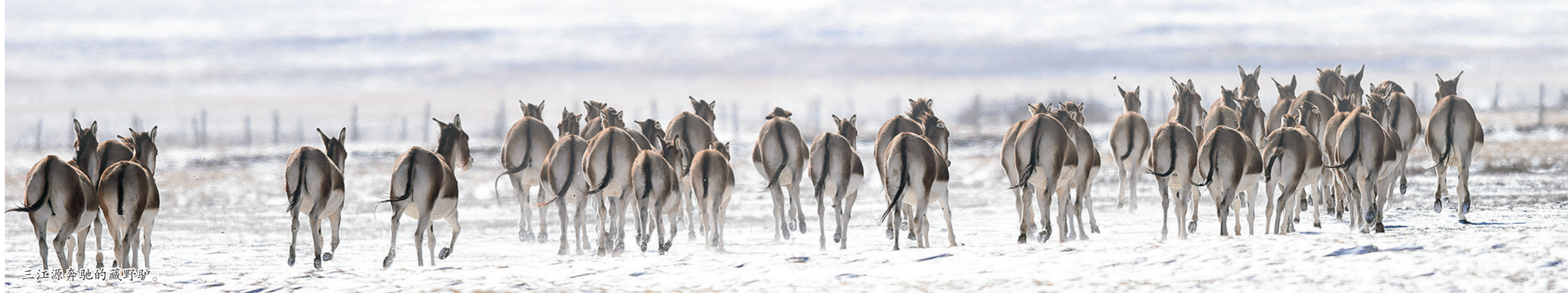
三江源奔弛的藏野马