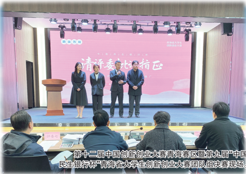
第十二届中国创新创业大赛青海赛区暨第九届“中国民生银行杯”青海省大学生创新创业大赛团队组决赛现场。