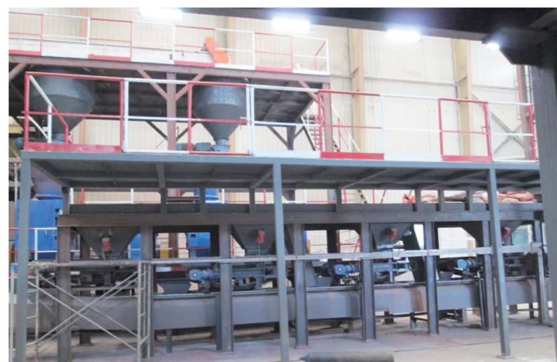
青海博阳盐业科技有限公司的生产车间。

几年来，为加速科创资源转化，大赛在筑优平台的同时，以赛聚力将科技资源聚集起来催生新动能，无论是在政策、资金、创新生态，还是在科技创新资源平台、高层次人才、创新扶持政策等方面，竭尽全力为创业者及其企业发展提供生生不息的驱动力。钻进实验室，一待就是半天；站在