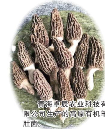
青海卓辰农业科技有限公司生产的高原有机羊肚菌。

每一届大赛中，主办方都会从创新创业、产业发展、金融资本、人才支持、营商环境等五个方面详细宣讲，其中包括了科技动态、创新创业项目培