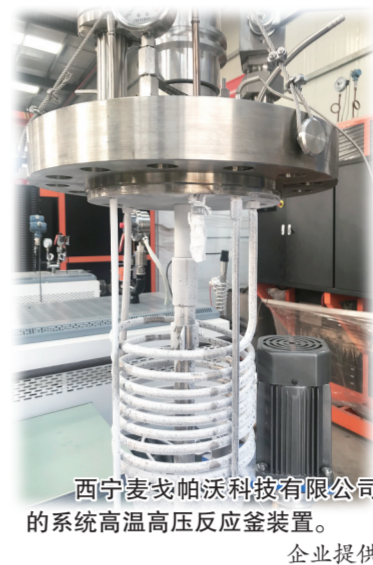
西宁麦戈帕沃科技有限公司的系统高温高压反应釜装置。