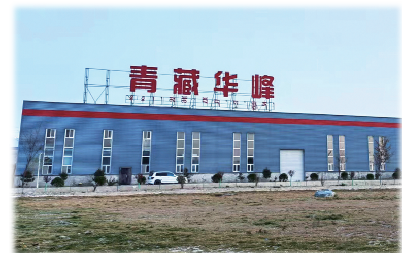
青海青藏华峰中峰蜂业有限公司的厂房外景。