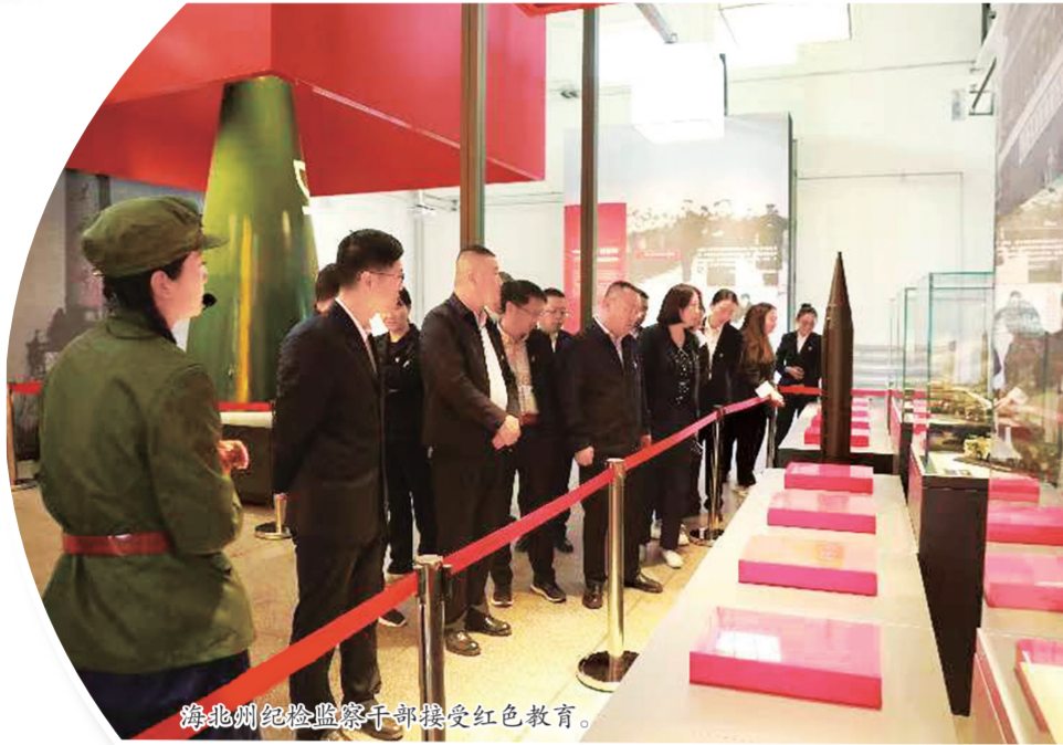
海北州纪检监察干部接受红色教育。

这次活动也是海北州纪委监委加强干部队伍建设的一个缩影。今年以来，海北州纪委监委牢牢把握开展学习贯彻习近平新时代中国特色社会主义思想主题教育和纪检监察干部队伍建设整顿主线，通过思想淬炼、政治历练、实践锻炼、专业训练等方式，擦亮纪检监察干部作风建设的“名片”，从严从实锻造纪检监察铁军。