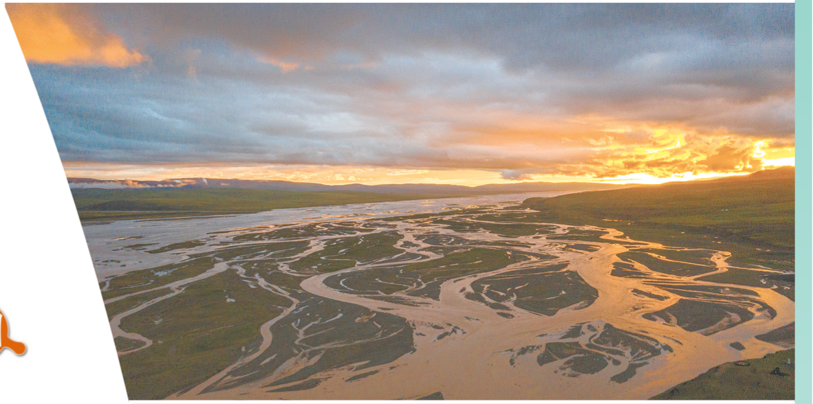
唐蕃古道的重要节点长江七渡口。

如今,唐蕃古道上的交通方式发生了很大的变化,但唐蕃古道所承载的历史文化价值却没有改变。