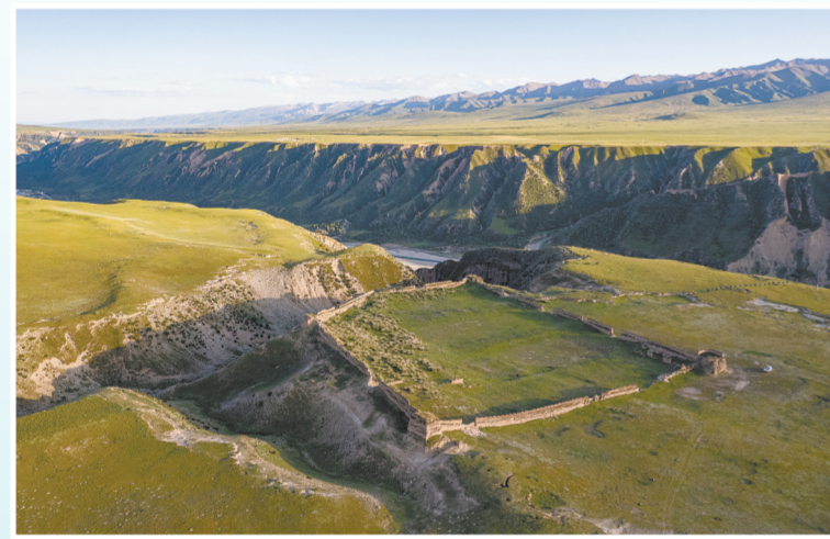
曾经的唐大非川驿站——大河坝营盘遗址。