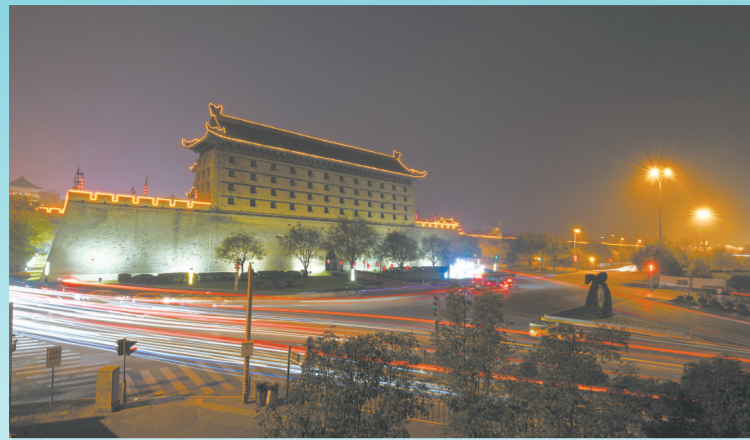
长安开远门,唐蕃古道从这里出发。