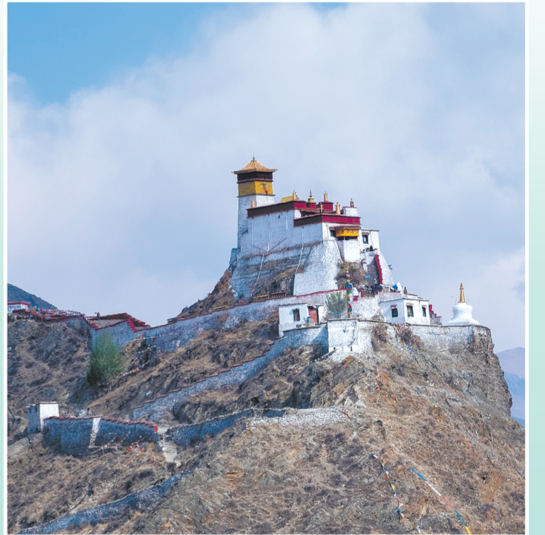
松赞干布与文成公主的夏宫——西藏山南雍布拉康。