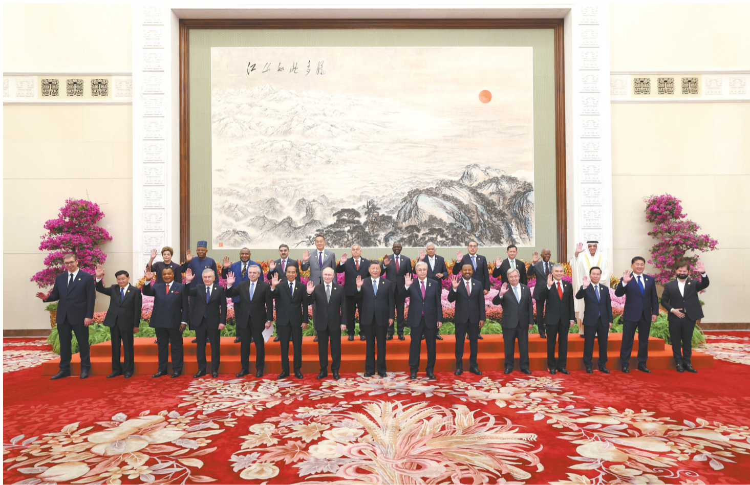
10月18日上午,国家主席习近平在北京人民大会堂出席第三届“一带一路”国际合作高峰论坛开幕式并发表题为《建设开放包容、互联互通、共同发展的世界》的主旨演讲。这是会前,习近平同出席高峰论坛的外国国家元首、政府首脑和国际组织负责人等国际贵宾集体合影。