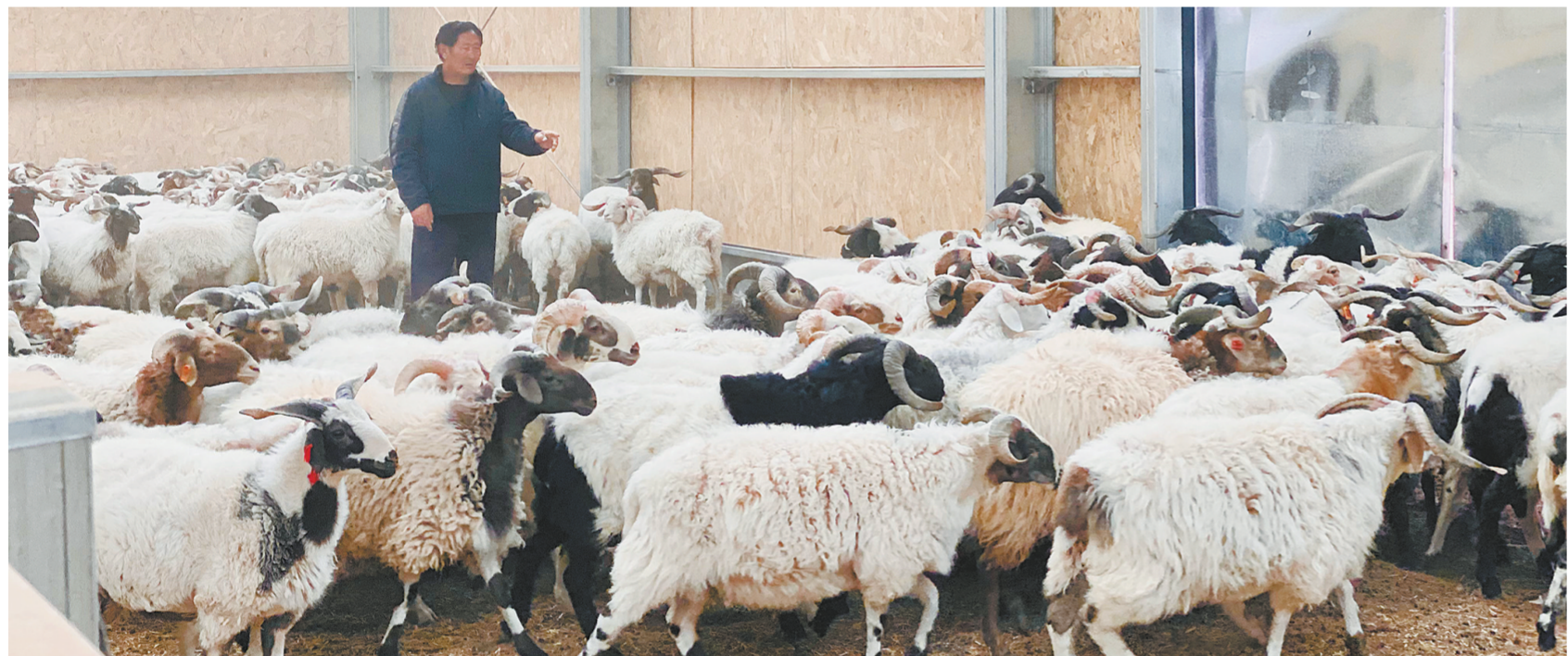
合作社养殖的藏羊。